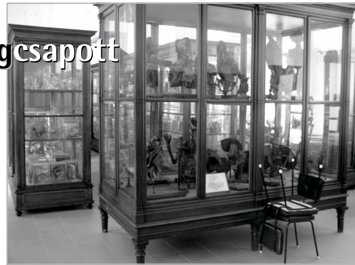
A vitrinekben nem gipszből és papírból gyúrt dinók

Én kifejezetten utálok ezt az ünnepet. Valahogy nem tudom átérezni. A temetőt is utálok. Kiráz a hideg a sok kötőmb láttán. Úgy gondolom, ha emlékezni szeretnénk valakire, nem kell ahhoz elmenni sehova. Megtehetjük ezt otthon, a buszon, a boltban... akárhol. És fordítva: az, hogy temetőbe megyünk, nem jelenti feltétlenül azt, hogy emlékezzünk. Undorodom attól a helytől, a műanyag Tesco-kolás üvegekbe dugdosott öszirózsáktól, a giccses „aranyfedelű” mécsesstartóktól, a selyemvirágoktól, és legjobban a műanyagkoszorúktól. Álszent dolognak tartom, hogy egy évben egyszer mindenki kötelező jelleggel magára erőlteti a szomorúságot, és fájó szívvel emlékszik vissza húsz éve elhunyt nagynénikéjére, akiről egyetlen emléke az, hogy gyerekkorában hasmenést kapott a sütitjétől. Persze vannak múltban élő emberek, akik tényleg szomorúak szegény nagynéni miatt, ezt tiszteletben is tartom, de nem tudom megérteni. Mikor hallgatom a rádiót, a televíziót, a rokoimait, és minden ezzel van tele, egy kicsit elszégyellem magam: nekem ez miért nem fáj egyáltalán? Másnak pedig miért rossz még húsz év után is? Húsz év alatt egy ember felnő, nem igaz, nem lehet megszokni, hogy valaki nincs és kész. Én a halált mindig is az élet részének tekintetem, ebből eredően soha nem is rendítettem meg különösebben, vagy ha mégis, hamar fel tudtam dolgozni. A családom teljesen más-más módon gondolkodik erről. Anyám szerint ez az ünnep