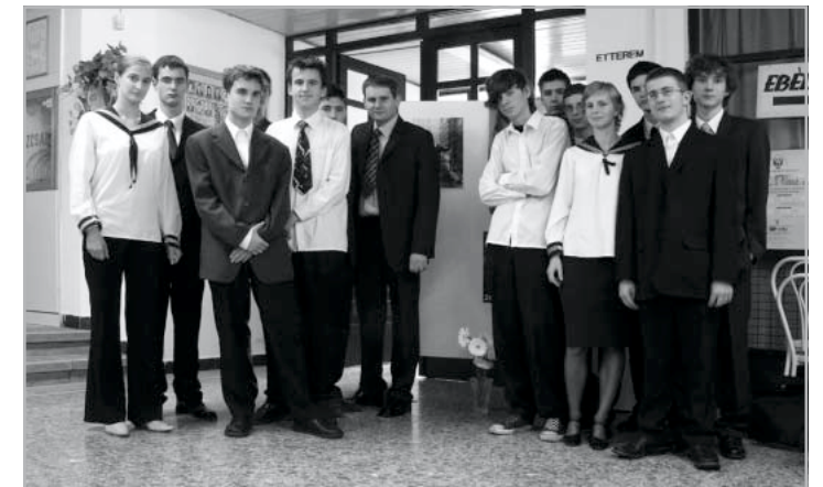
A film készítői

Nem akarom hozsannázni a készítőket – voltak benne hibák, naná, hogy voltak, hiszen mégsem a Warner Brothers világszínvonalú szerkesztőműhelyében, csak a Bárdos „félprofi” stúdiójában készült a montázs. De ismerjük el, ami jó, azért jár a vállveregetés. Emberemlékezet óta nem volt rá példa, hogy ilyen kussban ülte végig az egyórás műsort az elit-gimnazista nagyerdemű. Ismét megbizonyosodott, hogy generációnk nem közömbös, érdektelen és szénsötét,