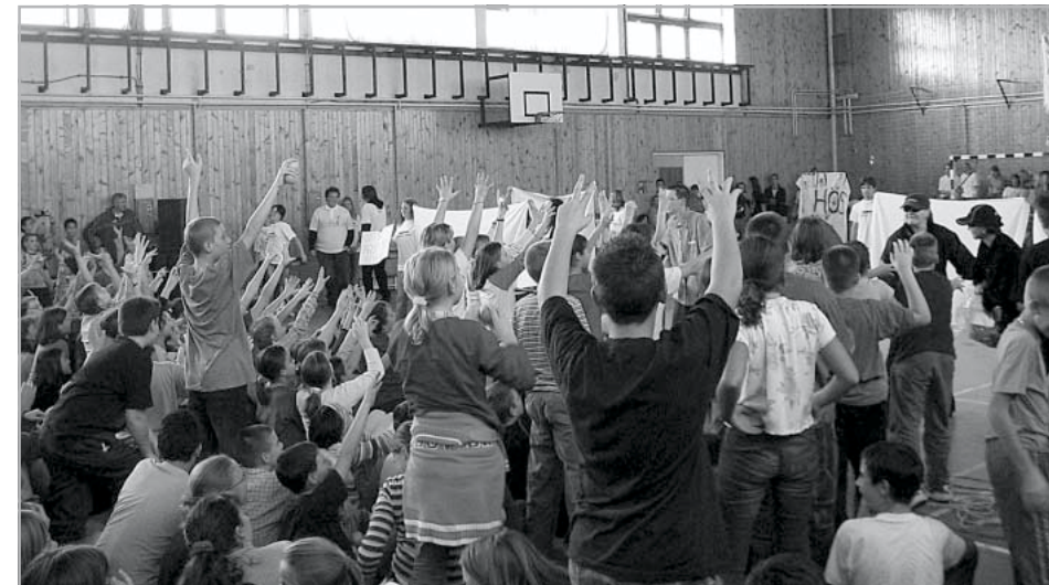
Csáperdő a túlélőknek

Mindeközben Anti ádáz harcát vívta a szépfüik-