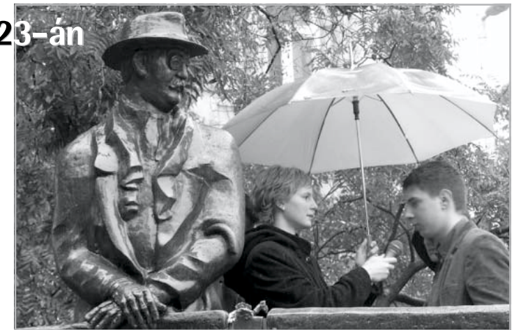
Az akasztott árnyékában

A szereplők egyike sem vérprofi színész, tehát nem várhattunk el „sinkovicsi” magasságokat, de ők legalább mindent beadtak. Néhányuknak szerintem sikerült is azonosulni szerepükkel. A történet összegyűrése és emésztetővé tétele is sikerült, bár néhol azért akadozott egy picit a sztori. Utóbbi nem feltétlenül a forgatókönyv, inkább az amatőr kivitelezés hibája. Azt nem tudom, hogy az eső mennyire volt szándékos háttértem, de jelentősen befolyásolta az összbnyomást. Úgy tűnt, az időjárás is velünk „sír”. (Erről az esős témáról azért lehet, hogy a