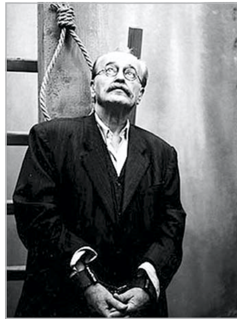
KÉP ÉS SZÖVEG: INTERNET

Korábbi hagyományainkhoz híven az idej tanévben is megtekintett egy, a tantárgyi koncentráció szempontjából rendkívül hasznos filmet iskolánk diákközössége. Legfeljebb azon szomorkodhatunk, hogy egy magyar nagyjátékfilmet külön kell megrendelniük az érdeklődőknek virágzó metropolitunk agonizáló filmszínházában.