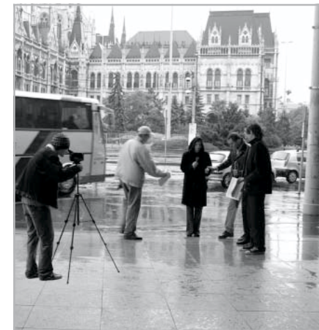
A beállítás megtervezése a Kossuth tér sarkán