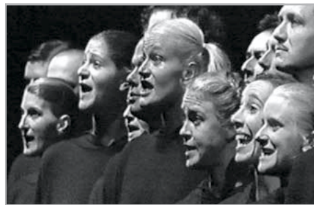
Egy sportdarab című darabja a bécsi Burgtheater 1998-as előadásában

Idén is kiosztották a több mint száz éves hagyományának örvendő Nobel-díjakat. Stockholmban október 7-én, csütörtökön jelentették be, hogy 2004-ben az osztrák Elfriede Jelinek író kapta az irodalmi Nobel-díjat. A díj 103 éves történetében ő a tizedik nő, aki megkapta a svéd kémikusról elnevezett elismerést. A hír az osztrák sajtóban meglehetősen vegyes érzelmekeket keltett, mivel sokan úgy vélték, hogy az író „különleges nyelvhasználata” és regényeinek merész témaválasztása nincs jó hatással az amúgy is háborgó belpolitikai és társadalmi életre. Jelinek korábbi műveiben többször és nyíltan írt a női szexualitásról, a női nem elnyomásáról és a nemek háborújáról. A fasiszmussal és erőszakkal is sokat foglalkozott, erre lehet példa a Sportstüek című műve. Valójában persze a legnagyobb botrányokat a belpolitikával kapcsolatos állásfoglalásai okozták. Valós politikai történeteket és Jörg Haidert bíráló gondolatokat fűzött össze több darabjában, melyek 1995-ben komoly fejtörést okoztak a Szabadságpartnak (FPÖ).