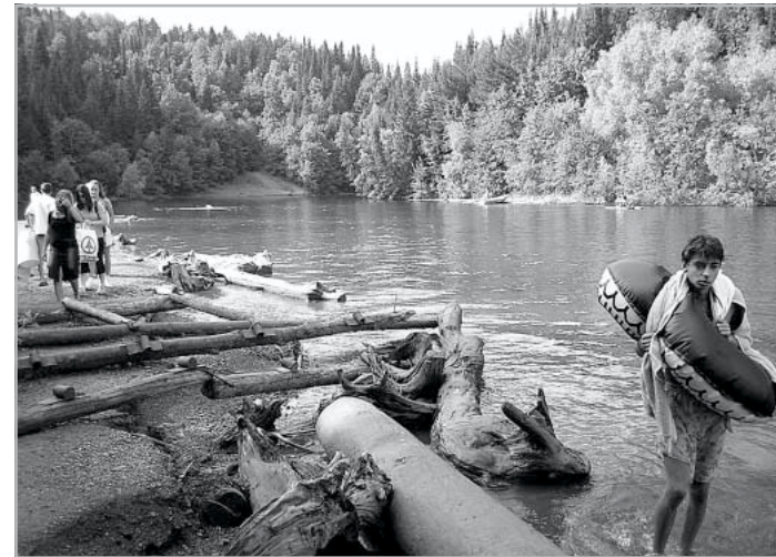
➔ 13. oldalról A NAGY OROSZ VALÓSÁG

csoportjának. Szerintem ugyanis az ő rajongásuk a kemény rock iránt más, mint fekete öltözékes távoli „társaiké”; ők ugyanis nem a zenére, nem annak esztétikai értékére figyelnek fel elsőként, és azután kezdenek el szimpatizálni az előadókkal, művészetükben tán még utánozni is őket (pl. saját együttes); lehet, hogy azok esetleg káros gondolatait teljesen figyelmen kívül hagyva. Az ő számukra az elsődleges befogadói élményt a kemény rockszámok agresszív, rebellis szövegei jelentik; a belőlük kiszűrődő torz, destruktív mondanivaló számukra a kora kamaszkori általános lázadásnak olyan eszközt, ideológiai bázisát jelent, mint kortársaik jelentősebb része számára a Britney Spears, Jennifer Lopez és társaik nevével fémjelzett haspólós-rózsaszín, ám ártalmatlan amerikai álomvilág. Ők tudatra ébredésük első fázisában valami igazán merész módon szeretnének lázadni a világ, a felnőttek, az iskola stb. ellen; talán kivagyiságból, talán kíváncsiságból kacsintanak a totális nihilizmus, a sátánizmus, a fekete mágia, az anarchia és más, a hevi metál-számok némelyikének szerves mondanivalóját képező „furcsa gondolat” iránt. A hevi metál keményvonalának képviselőit nem zene-, hanem életművészeknek fogják fel, példaképként tekintenek rájuk. A tiltott gyümölcs mindig edesebb, így a külső-