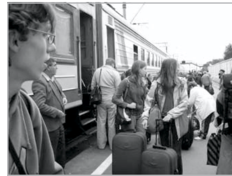
Megérkezés az ismeretlenbe

Augusztus 5-én hajnalban különbusz vitte a „delegációt” (ez nem vicc, ez volt a hivatalos megnevezésünk) Budapestre, a repülőtérre, ahonnan Moszkvába repültünk. A városban csak egy rövid buszos városnézésre, pénzváltásra és ebédre jutott idő, aztán mentünk is a pályaudvarra. Ami azokat a bizonyos orosz viszonyokat illeti, engem ott ért az első sokkhatás. Finoman fogalmazva, „guggoló” alkáni vécéhez már volt szerencsém máshol is, de más országban legalább mindenki becsukta az ajtót, miközben folyó ügyeit intézte... A vonaton első dolgunk volt