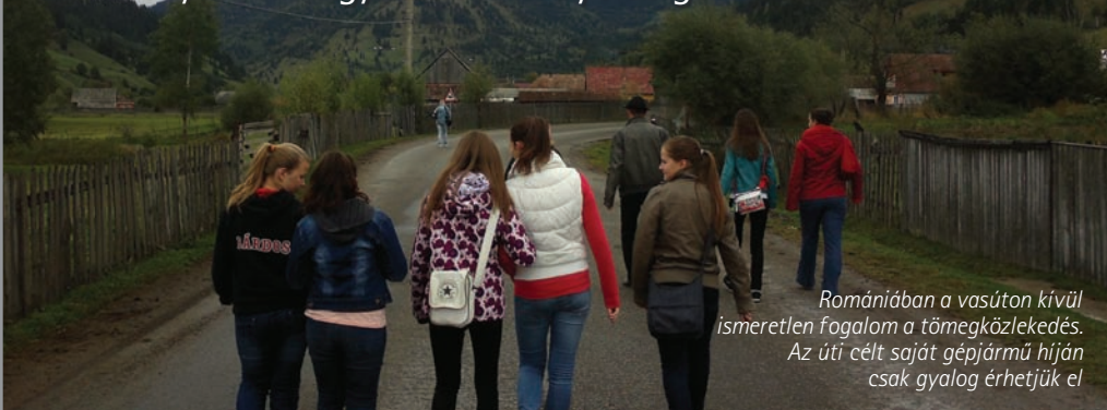
Romániában a vasúton kívül ismeretlen fogalom a tömegközlekedés. Az úti célt saját gépjármű híján csak gyalog érhetjük el

A Bányász Táncgyüttessel Erdélyországban