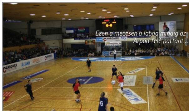
Ezen a meccsen a labda mindig az Árpád felé pattant...